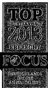
TOP Rechtsanwalt "Fachbereich"